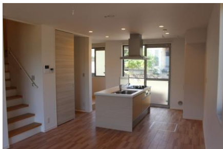
↑キッチン(イメージ)