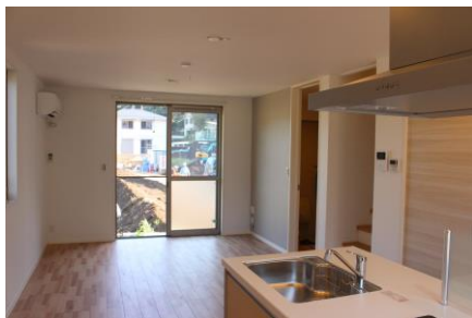
↑リビング(イメージ)