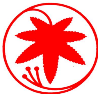
いろはもみじ (村の木)