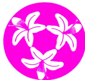
みつばつつじ (村の花)